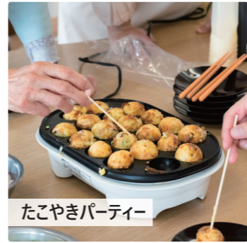
たこ焼きパーティー