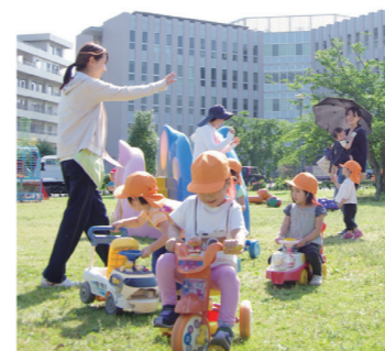
わんぱく保育園 病院の敷地内にあるスタッフ専用の保育園。0歳児から年中さんまで預けることができます。

誰が日勤か夜勤か一目でわかるように制服が違います。そのため、日勤と夜勤の引継ぎがスムーズになり、残業防止につながります。