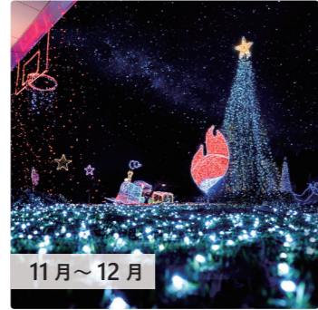
11月～12月 イルミネーション 患者さまやご家族にクリスマスを楽しみ過ごしていただきたい。そして、お世話になっている地域に感謝を込めて、毎年クリスマス時期にイルミネーションを灯しています。