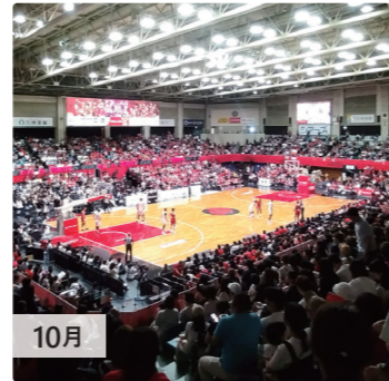
10月 Bリーグ開幕戦！ プロバスケットボールチーム・熊本ヴォルターズの開幕戦が毎年10月より開催されます。