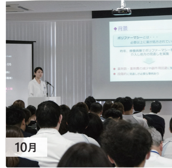
10月 院内学会 桜十字で働く医師、看護師、介護福祉士、理学療法士、作業療法士、管理栄養士など、それぞれの専門を活かした研究結果や仕事での取り組みを毎年発表しています。