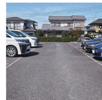
無料駐車場 スタッフ専用の駐車場があり、無料で使用できます。

介護職専用 社員寮 遠方より入職したスタッフが地域や職場に馴染むまでの時期を安心して過ごし、職務に専念できる環境を整えたいと、独身寮を完備。寮費は、自立への資金を貯えられるように設定されています。※提携不動産会社の紹介手数料割引もあり、独り立ちまでをサポートしています！ ※現在、介護職の方専用となっております。詳しくはお問合せください。