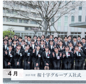
4月 2025年度 桜十字グループ 入社式