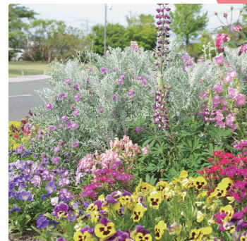
桜十字にはお花が一杯！ 病院の庭や周りには四季の移り変わりを楽しんでいただけるよう、季節を彩るさまざまな花を植えています。