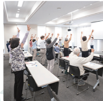
生き活き健康教室 定期的に地域の方々に向けた健康教室を開催しています。