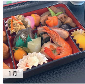
1月 お正月の社員食堂はおせち料理

桜十字病院は患者さまをはじめ、そのご家族、地域の方々、そして、病院で働くスタッフに少しでも多くの「楽しい」をお届けするため沢山のイベントを催しています。