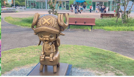
コロナ禍の休日は県内ドライブが多いです。 これはチョッパー！