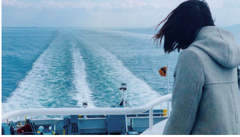
気分転換にフェリーに乗ってみました。