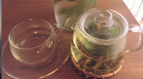
旅先で見つけたハーブティーで リラックス♡