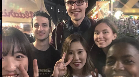
ラトビアに短期留学！