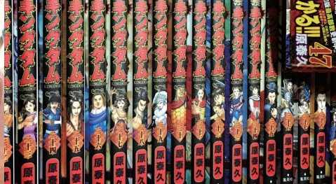
ハマったコミックスは集めます。 キングダムと進撃の巨人は全巻あります。