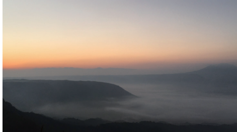
休日の楽しみはドライブ。 大観峰の雲海は絶景です！