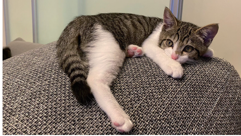
一緒に暮らす愛猫のこてつ君