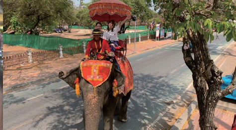
海外旅行が好きです！