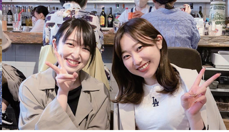
大学時代の友達とカフェに♪