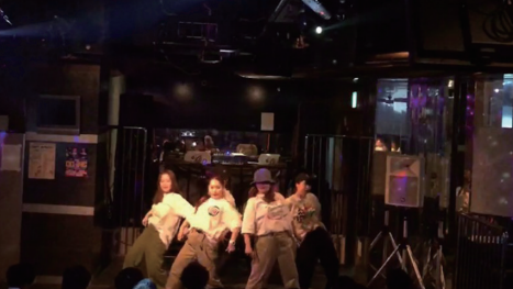
部活・サークルはダンスでした！