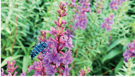
見かけると幸運が訪れるという ブルービーを阿蘇で発見！