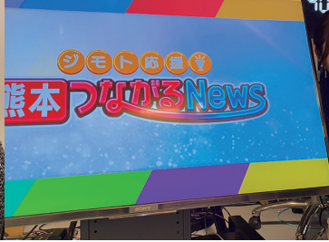
地元のテレビ・ラジオ・イベント MC 等、喋るお仕事もしています！