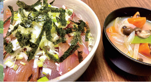
自炊は美味しさにも彩りにも こだわります！