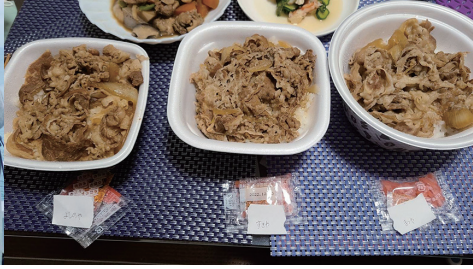
コロナ禍での密かな楽しみ（牛丼の食べ比べ）