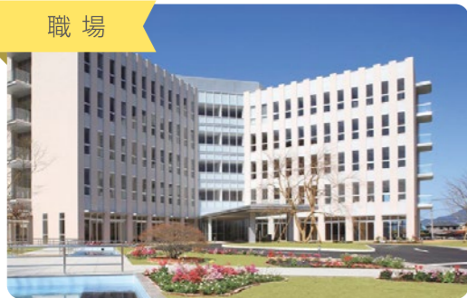
桜十字病院の病棟内。 630の病床、21の診療科目で診療しています。