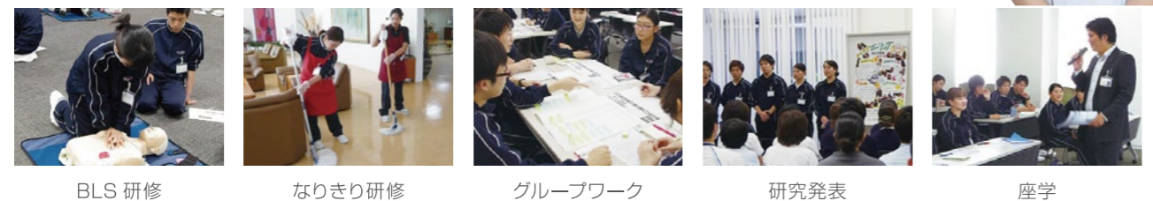
BLS 研修 なりきり研修 グループワーク 研究発表 座学