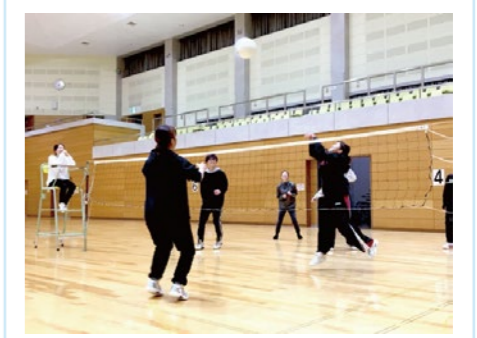
同期スポーツレクリエーション(秋ごろ) 同期の仲を深めるために開催しています。