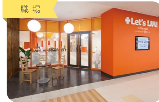
熊本市の中に、10店舗以上あります。