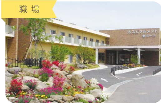
老人ホーム「ホスピタルメント」100名を超えるお客さまが暮らす、にぎやかな大所帯です。