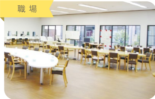
桜十字病院内のLet'sリハ! PLUS桜十字。